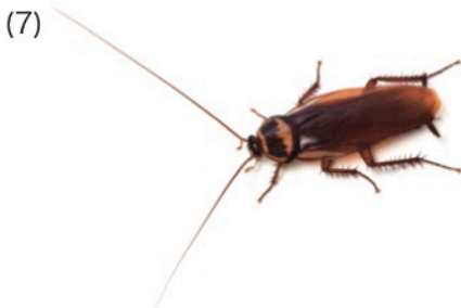
コワモンゴキブリ