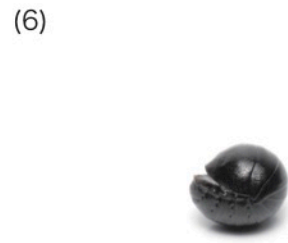
ヒメマルゴキブリ