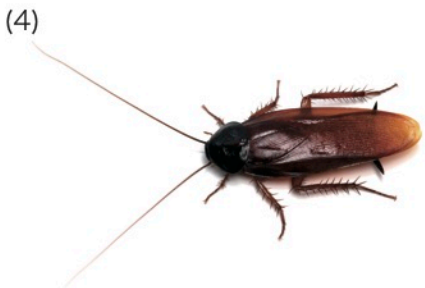
アカズミゴキブリ