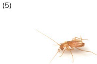
ホラアナゴキブリ