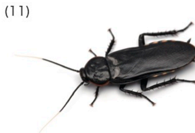
バサリスサシガメゴキブリ