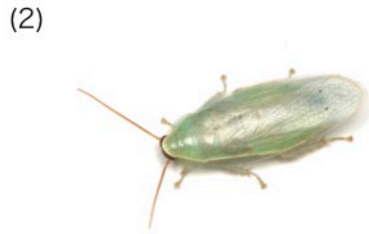
グリーンバナナゴキブリ