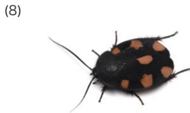
オレンジスポットミノゴキブリ