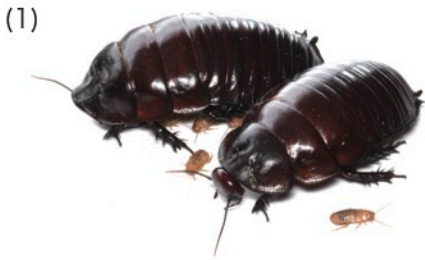
ヨロイモグラゴキブリ